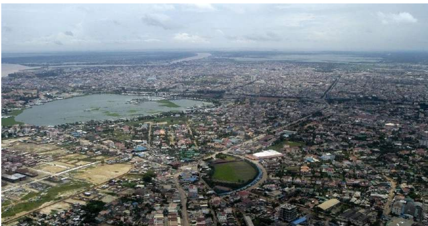
Phnom Penh, stolica Kambodży

24 stycznia 1956 roku Polska i Kambodża nawiązały stosunki dyplomatyczne