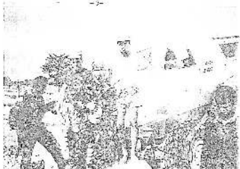
ST. SIENŃ. ŻUKOWSKI, S. SIENŃ. ŻUK W ŁOŻAKYSTWIE KONSTRUKCYI INŻYNIERZY NA TLE UKIERUNKOWANIEGO "POLFA"