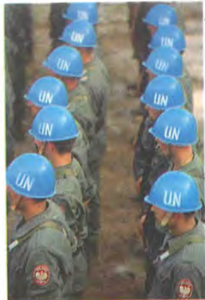
«Голубые каски» — в какой бы уголок планеты ни забрасывал их служебный долг — повсюду становились символом порядка, умиротворения и спойствия. Так было и в Камбодже. Об этом очерн Яцек Палкевича на стр. 27.