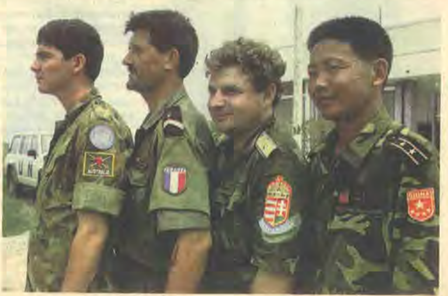
Перевела с итальянского Елена ЛИВШИЦ