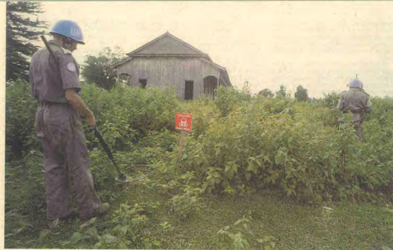
Яцек ПАЛКЕВИЧ, итальянский путешественник — специально для «Вокруг света»